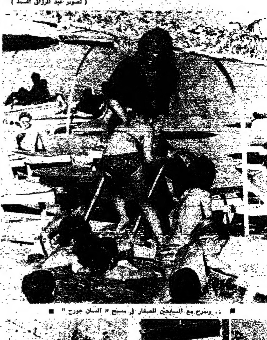
دمشق مع السامحون الصغار في مسرح " انسان جورج "

داليدا تسيير جربة ليام غسق . انسان جورج